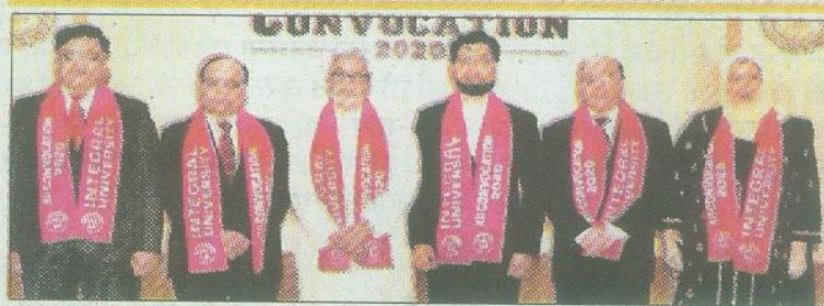
इंटीग्रल यूनिवर्सिटी के दीक्षांत समारोह में मंगलवार को मौजूद चांसलर, कुलपति, प्रति कुलपति और अन्य पदाधिकारी।

इंटीग्रल यूनिवर्सिटी के दीक्षांत समारोह में विज्ञान और प्रौद्योगिकी विभाग के सचिव ने छात्रों से की अपील