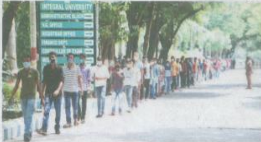
اننگرل یونیورسٹی میں ٹسٹ میں شرکت کے لئے جاتے ہوئے طلبہ

یونیورسٹی ہلٹی ٹسٹ برائے ٹیکنیکل ذراعتی تعلیم میں ہزاروں طلباء کی شرکت