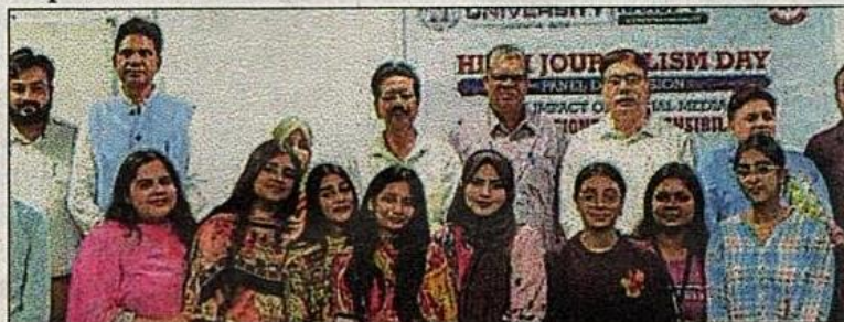
Dignitaries and students during a panel discussion on Hindi Journalism Day at Integral University.